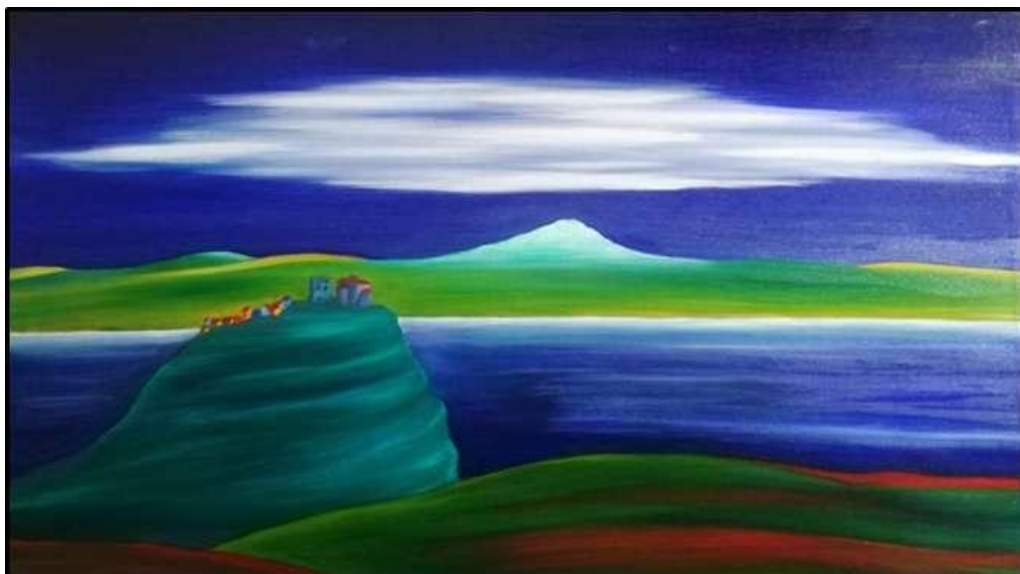
Dipinto di Giuseppe Schillaci