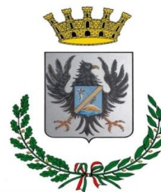
Città di Misterbianco (CT)