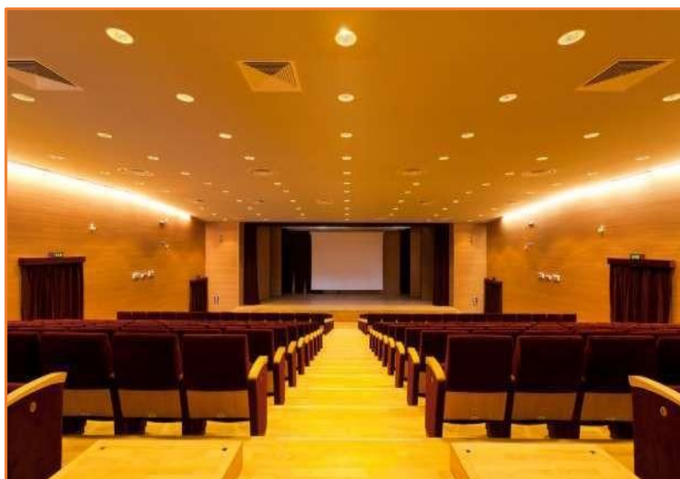
Teatro Nelson Mandela Misterbianco